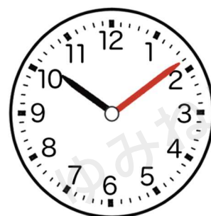
(じゅうじ きゅうふん)