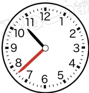
(じゅうじ さんじゅうはっふん)