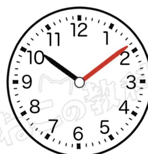
(じゅうじ きゅうふん)