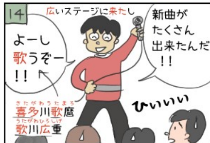
※東海道五十三次=歌川広重の浮世絵