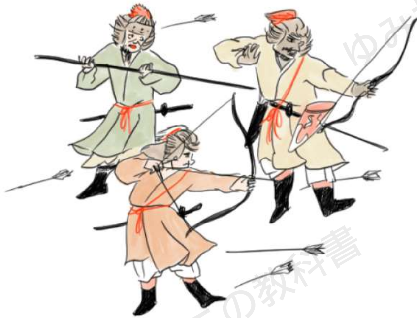
「蒙古襲来絵詞」より