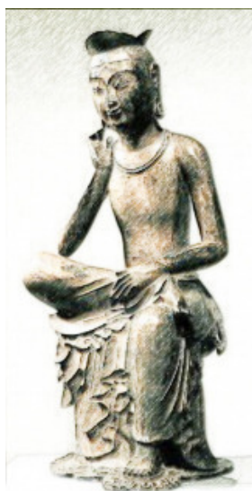
朝鮮の弥勒菩薩像